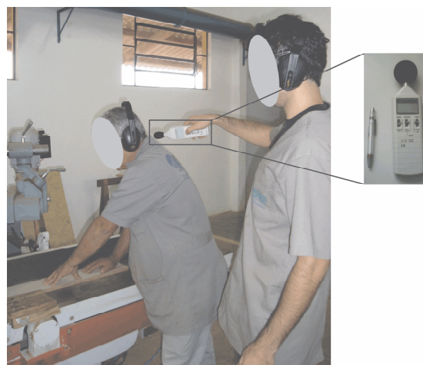
FIGURA 1 Medição do nível de pressão sonora com decibelímetro.